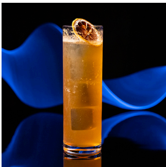
Earl Grey Gin Tonic アールグレイ ジントニック 2,100 yen

Japan Inspired Gin Tonic with Japanese Craft Gin Fresh and Dried Shiso Leaves, Pickled Plum 日本のクラフトジンと紫蘇で仕上げた和風ジントニック