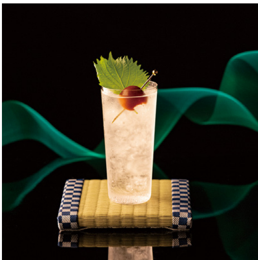
Gin Tonic "Rising Sun" ジントニック ライジングサン 2,100 yen

Japan Inspired Gin Tonic with Japanese Craft Gin Fresh and Dried Shiso Leaves, Pickled Plum 日本のクラフトジンと紫蘇で仕上げた和風ジントニック