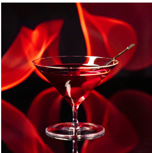
Midnight MANHATTAN ミッドナイトマンハッタン 2,400 yen

Los Danzantes Reposado, YAMAZAKI Umesyu Pink Grapefruit Juice, Lime Juice Green Tea Syrup, Tonic Water, Yukari メスカル・梅酒・緑茶にゆかりの塩味を合わせた 有名映画の大女優をイメージしたエネルギッシュなカクテル