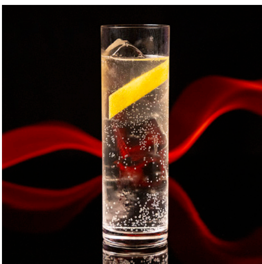
Good Old Days グッドオールデイズ 2,000 yen

Nozawa Onsen Distillery Iwai Gin Cranberry Juice, Grenadine Syrup, Tonic Water 国産クラフトジンを使用した華やかで優しいジントニック