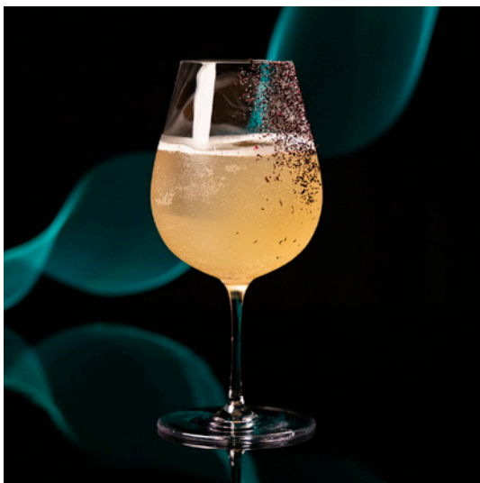
Someday at Tiffany's いつの日かティファニーで 2,500 yen

Los Danzantes Reposado, YAMAZAKI Umesyu Pink Grapefruit Juice, Lime Juice Green Tea Syrup, Tonic Water, Yukari メスカル・梅酒・緑茶にゆかりの塩味を合わせた 有名映画の大女優をイメージしたエネルギッシュなカクテル