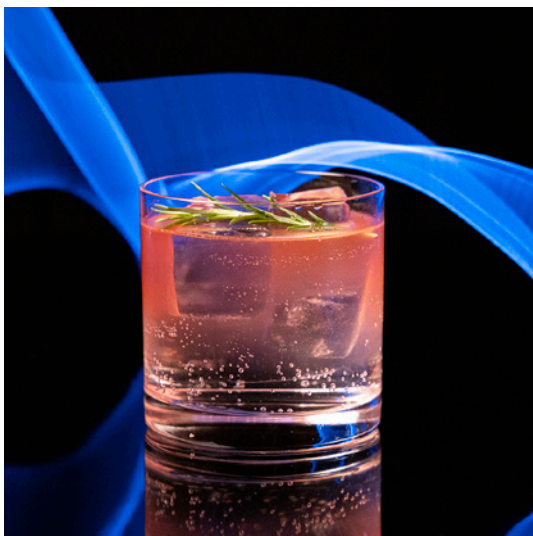
Harvest ハーベスト 2,200 yen

Nozawa Onsen Distillery Iwai Gin Cranberry Juice, Grenadine Syrup, Tonic Water 国産クラフトジンを使用した華やかで優しいジントニック